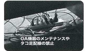
OA機器のメンテナンスやタコ足配線の禁止

製作協力: 富士市/岳南排水路管理組合/ラ・ホール富士/フィルムコミッション富士 資料提供: NITE・製品安全センター