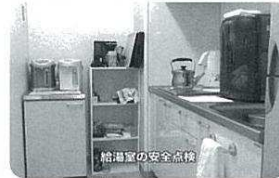
給湯室の安全点検