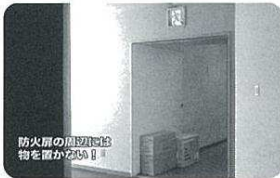
防火扉の周辺に物を置かない